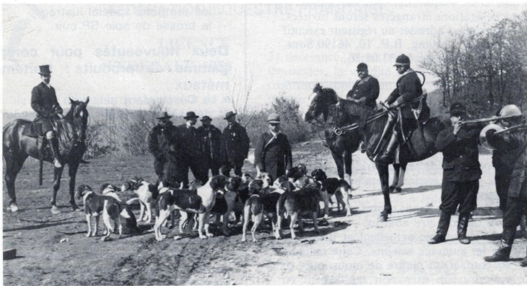
Un rendez-vous du Rallye Grésigne au son des trompes.

Pour ce qui est du bouton de l'équipage : il représentait un sanglier marchant avec au-dessus la devise « Rallye Grésigne ».